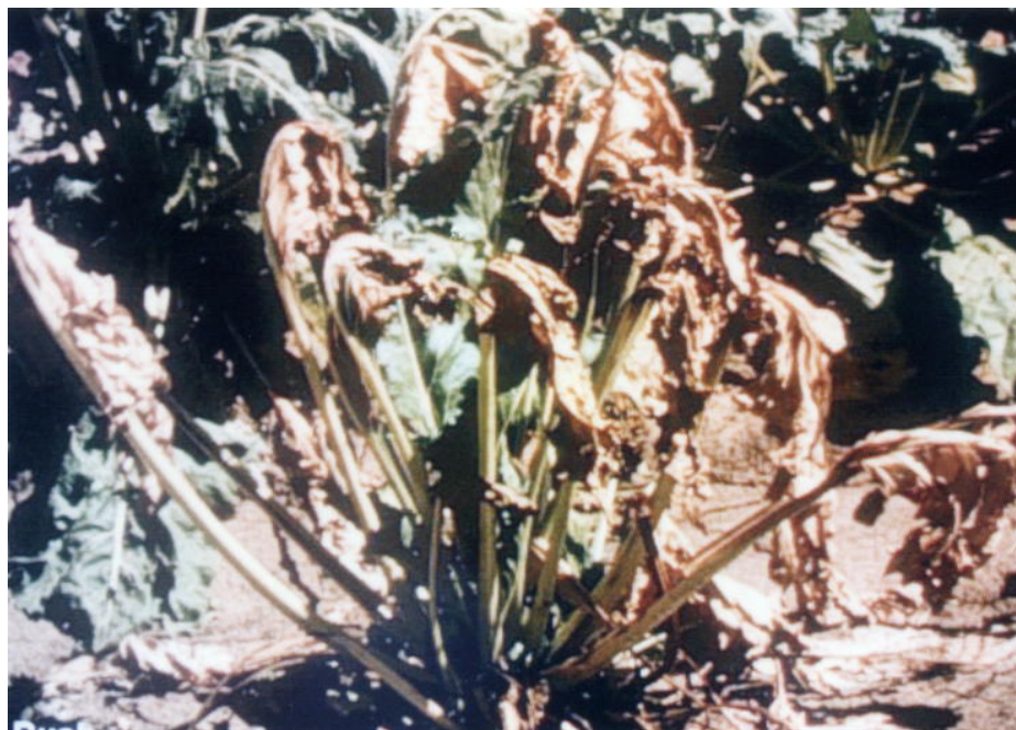
شکل ۱- زردی و پژمردگی چغندر قند در اثر آلودگی به Fusarium oxysporum f.sp. betae Fig.1 Yellowing and wilting of sugar beet by Fusarium oxysporum f.sp. betae infection